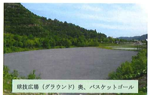
球技広場(グラウンド)奥、バスケットゴール