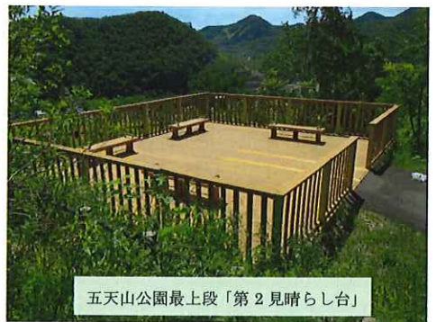
五天山公園最上段「第2見晴らし台」