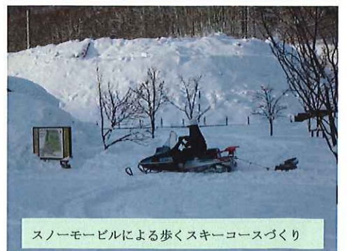
スノーモービルによる歩くスキーコースづくり