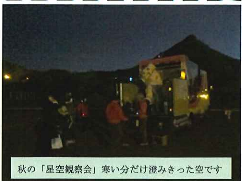
秋の「星空観察会」寒い分だけ澄みきった空です