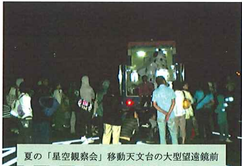
夏の「星空観察会」移動天文台の大型望遠鏡前

空気のきれいなこの公園では普段観ることのできない星座や星、飛行する衛星の様子を観察することができます。また、昨年は移動天文台の大望遠鏡で「月面X」を見ることもできました。ここ五天山公園は雲がかりやすく、せっかくの星空を見ることのできないこともあります。また、月や星はじつとしていません。移動しましたので、雲が出てしまうとちょっと厄介です。