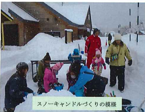
スノーキャンドルづくりの様