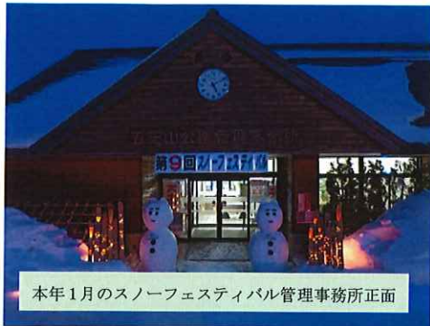
本年1月のスノーフェスティバル管理事務所正面

五天山公園職員により事前にスノーキャンドルを飾る台や、たくさんのキャンドルをハート型に並べておきます。当日はご来園のお客様にもスノーキャンドルやイグルーをつくっていただきます。本年 1 月「スノーフラッグ取り競技」写真を撮ったり Snow には備わっている、和太鼓の音に合わせ、