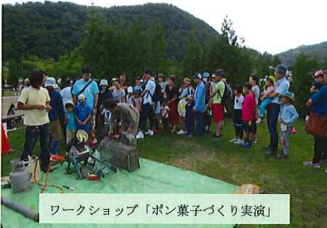
ワークショップ「ボン菓子づくり実演」