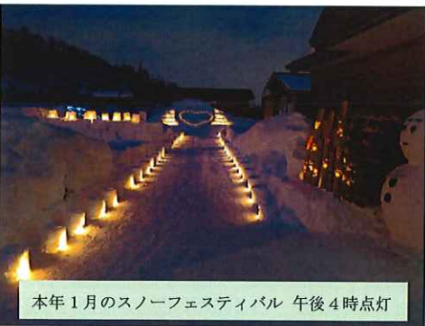
本年1月のスノーフェスティバル 午後4時点灯