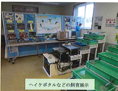
ヘイケボタルなどの飼育展示