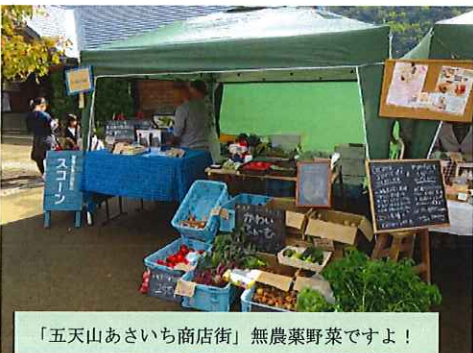
「五天山あさいち商店街」無農薬野菜ですよ!