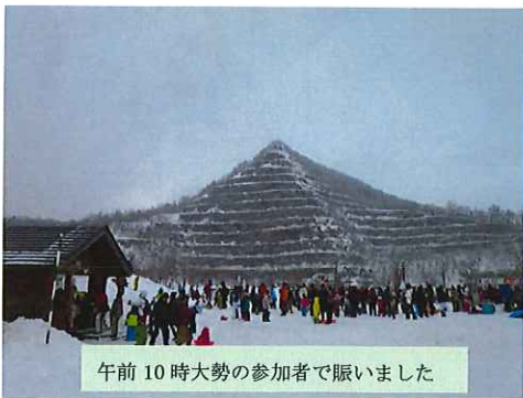
午前 10 時大勢の参加者で賑いました