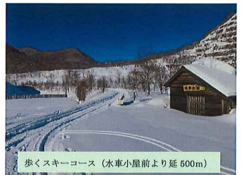
歩くスキーコース(水車小屋前より延500m)