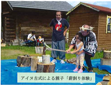
アイヌ古式による親子「薪割り体験」